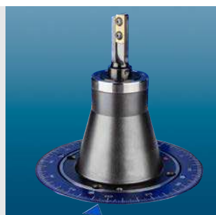
HG балансировочный адаптер/HG balancing adapter (HG01/02/03/04)