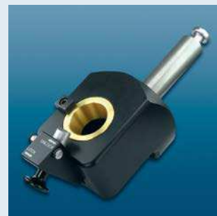
Державка-адаптер под SK Tool holder adapter SK