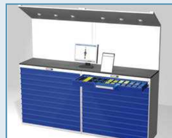
Пример оснащения/Application Example