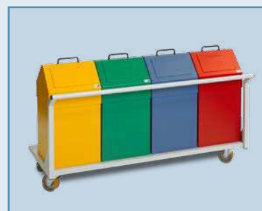
Модуль утилизации отходов Waste disposal module