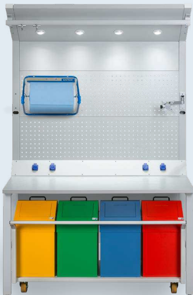
На рис. изображены: рабочий верстак с кронштейном под монитор, модулем утилизации отходов и диспенсером для бумажных полотенец Picture shows: Assembly module with screen holder, waste disposal module and paper dispenser