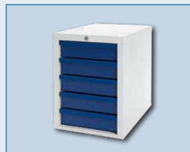
Напольный шкаф с выдвижными ящиками Drawer cupboard