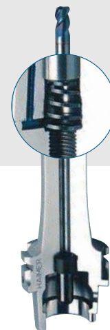
Пружина для легкого изъятия инструмента из патрона Tension spring for length presetting