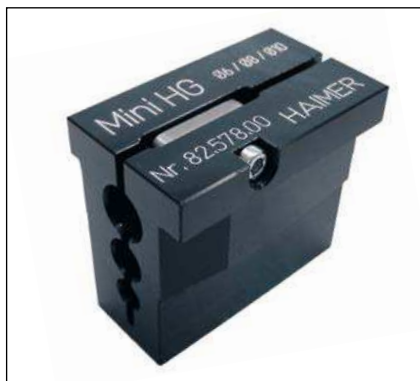
Устройство сборки для HG Mini Assembly device for HG Mini