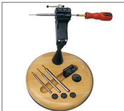
HG Mini с динамометрическим ключом и устройством сборки HG Mini with torque wrench and assembly device