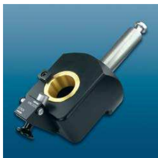
Державка-адаптер под SK Tool holder SK

База – без державки, 4 x 90° индексированный Tool Clamp – without tool holder, 4 x 90° indexable