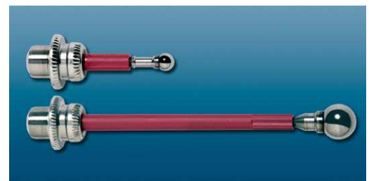
Kurzer Tasteinsatz Ø 4 mm/Короткая насадка диаметром 4 mm Langer Tasteinsatz Ø 8 mm/Длинная насадка диаметром 8 mm

Technische Änderungen vorbehalten/Оставляем за собой право на технические изменения без предварительного уведомления